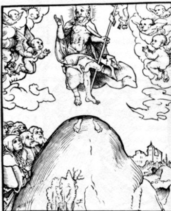
Lukas Cranach d.Ä. "Christi Himmelfahrt"

man muss nicht im Heiligen Land leben, um Erfahrungen mit Christus zu machen. Hier und heute werden diese Erfahrungen mit ihm gemacht. Jeder Ort und jede Zeit ist Ort und Zeit, da Christus neu Glauben weckt und damit gegenwärtig ist. - Das ist der Sinn der Geschichte von der Himmelfahrt Christi.