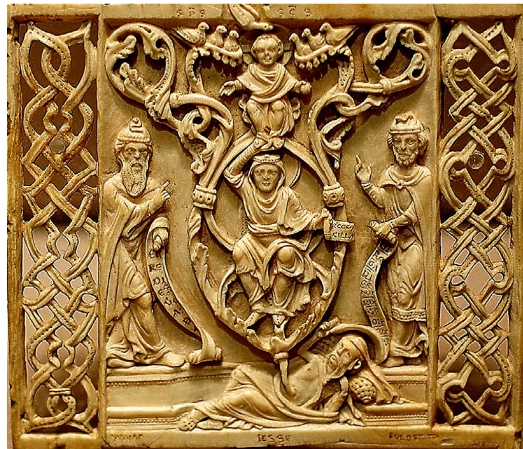
Aus Elfenbein um ca. 1200 im Besitz des Louvre Dargestellt wird der Stammbaum Christi in Gestalt eines wirklichen Baumes, der herauswächst aus der Figur Jesses, des Vaters König Davids von Israel.